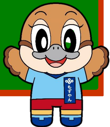
大阪府広報担当副知事 もすやん