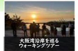
大阪湾沿岸を巡るウォーキングツアー