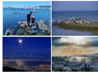
ぐるっと大阪湾フォトコンテスト入賞作品より