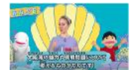
子ども向け啓発シリーズ動画「ハッピー・オオサカ・ベイベース」

広域的な連携の強化、情報提供・広報の充実、環境教育・環境学習の推進及び住民参加の推進等