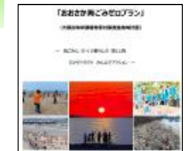
おおさか海ごみゼロプラン