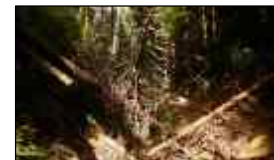
流木対策工 (河内長野市)