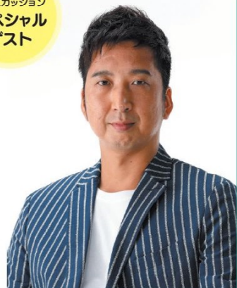
元プロ野球選手 藤川 球児 氏