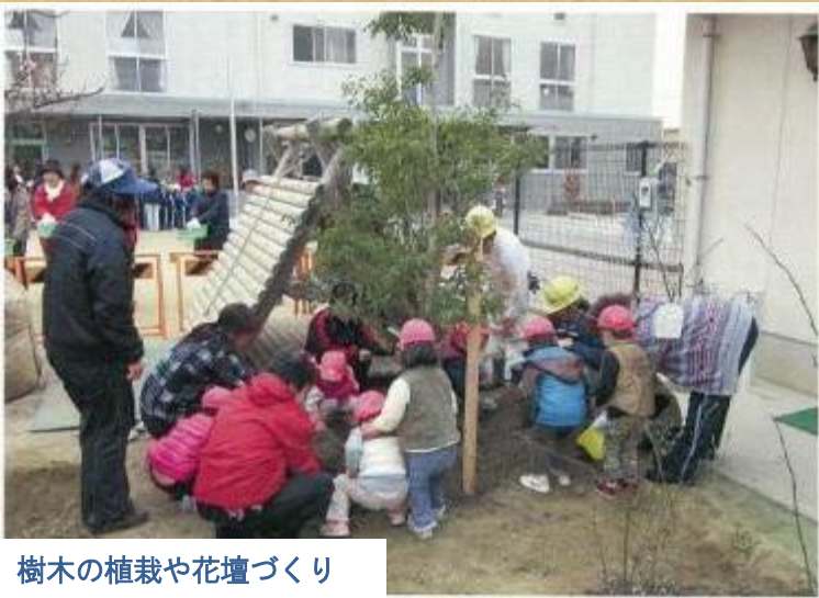
樹木の植栽や花壇づくり