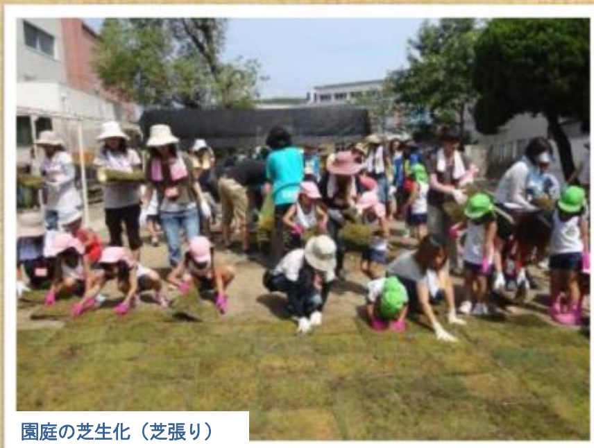
園庭の芝生化（芝張り）