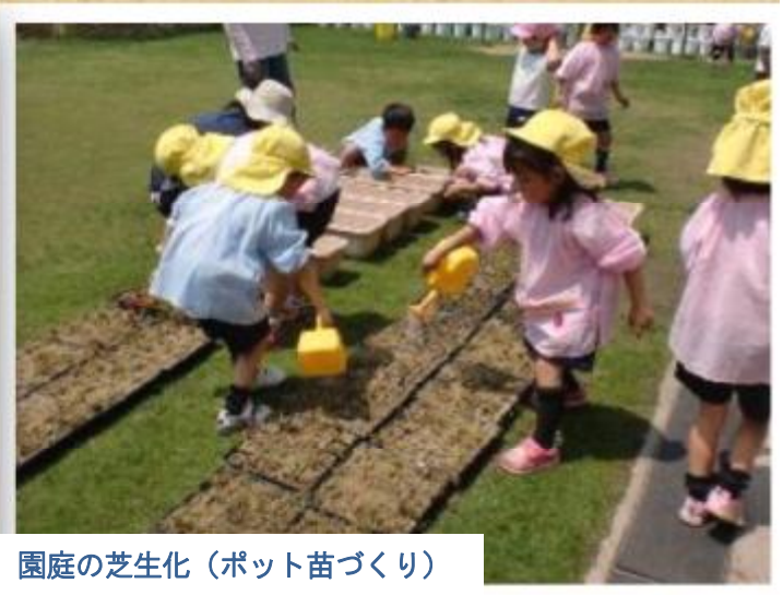
園庭の芝生化（ポット苗づくり）