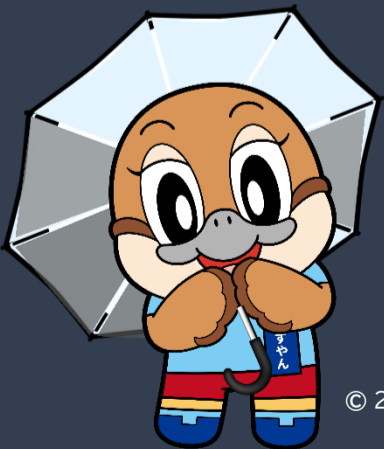
大阪府広報担当副知事もずやん

府民のみなさまにご活用いただけるよう、暑さから身を守る3つの習慣をはじめ、暑さを知らせる情報を提供するサービスの紹介や、暑さから身を守るための行政の取組、暑さ対策に役立つ情報などの発信をしています。ぜひ、ご覧ください。