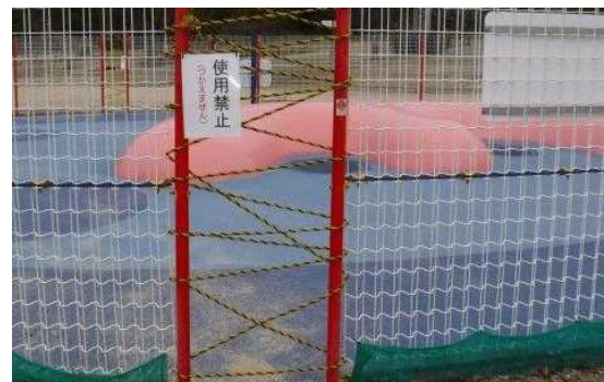
立入禁止措置状況