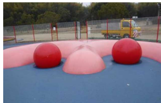
ボール（φ850）設置時の状況