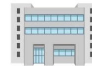
府教育庁(支援教育課)