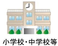
小学校・中学校等