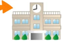
小学校・中学校等 府立高等学校