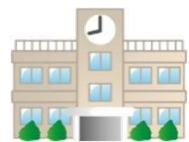
小学校・中学校等