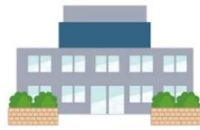
市町村教育委員会