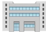
府教育庁(高校改革課)

・支援教育サポート校の活用 ・医療等専門家チームの活用 ・支援学校リーディングスタッフの活用 等