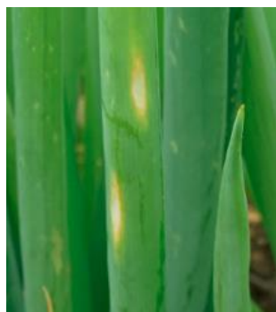
えそ条斑病の葉の病斑