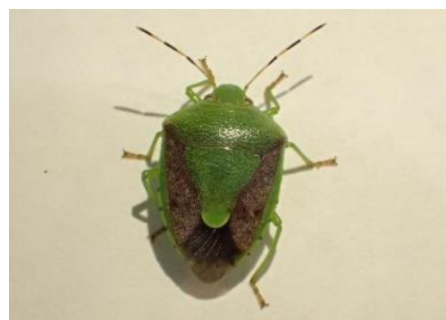
チャバネアオカメムシ