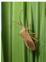
ホソハリカメムシ