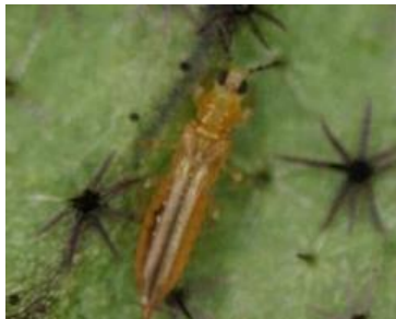
ミナミキイロアザミウマ成虫※