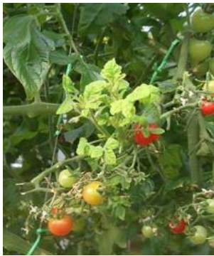
トマト黄化葉巻病発症株

6月～8月は農薬危害防止運動月間です。農薬は適正に使用し、事故・被害を防止しましょう！