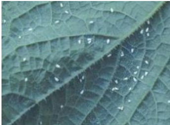
コナジラミ類成虫*