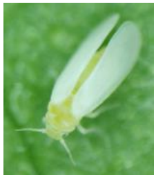
タバココナジラミ※