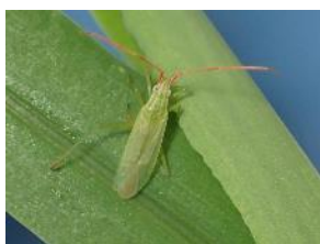
アカヒゲホソミドリカスミカメ (イネホソミドリカスミカメ)