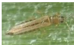
ネギアザミウマ成虫