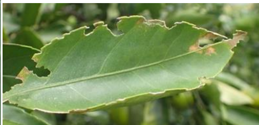
成虫による葉の被害