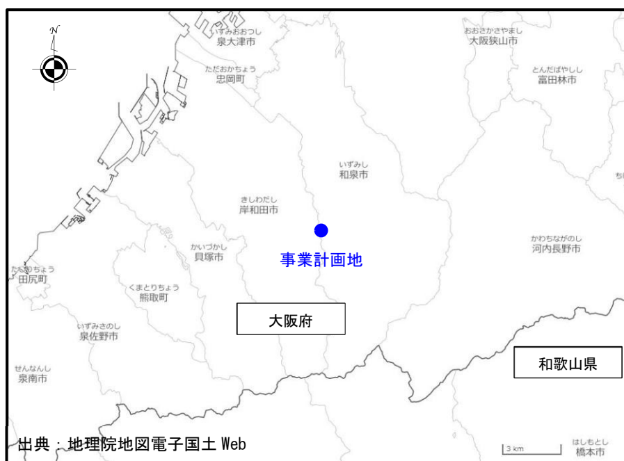
図1 事業計画地の位置(広域)

本事業の実施場所は、図1に示すとおり、大阪府和泉市テクノステージ二丁目3番9号、10号、11号及び12号であり、工場や事業所等が点在している工業専用地域である。