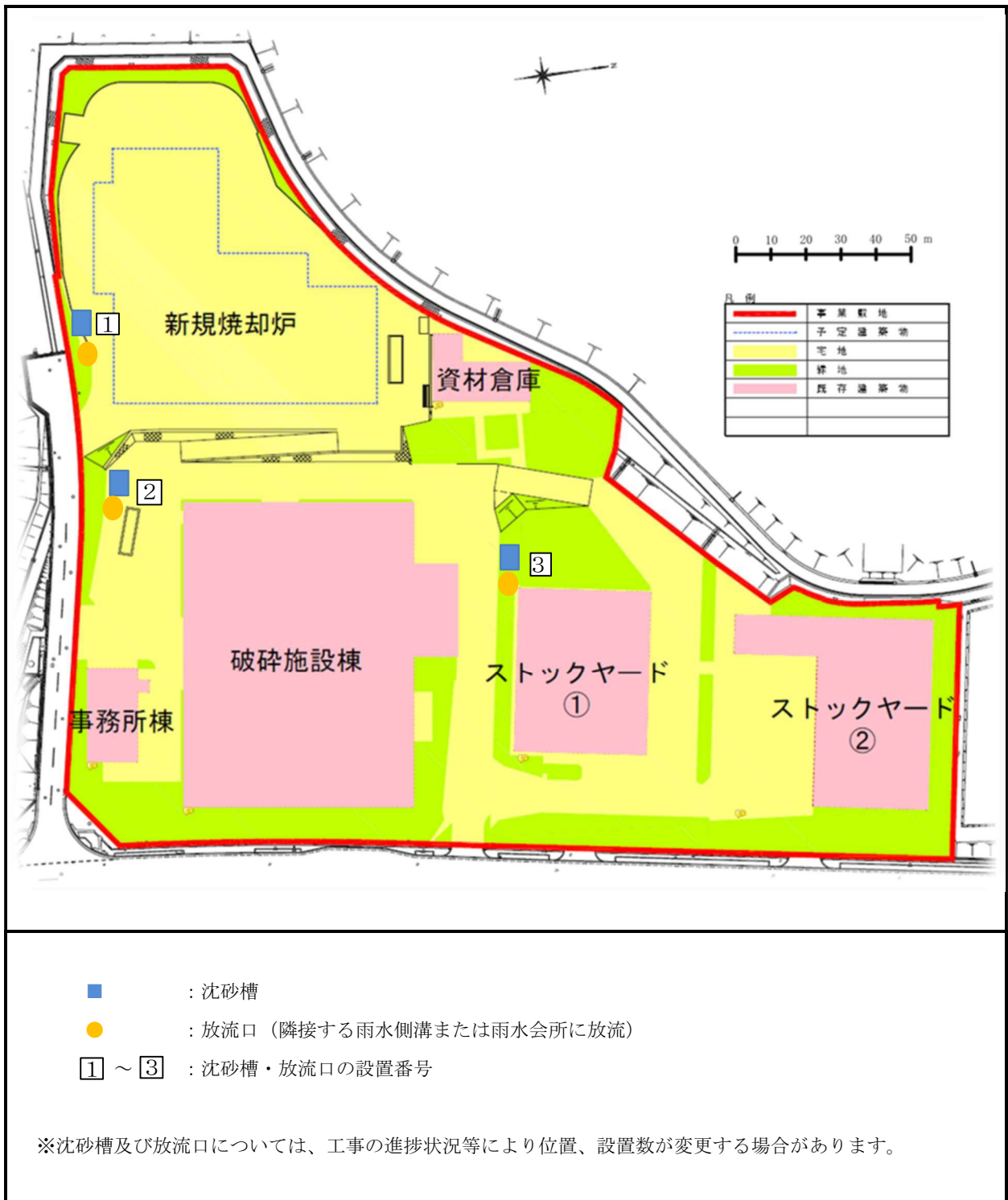
図 2 - 1 現地調査地点(工事の実施時)