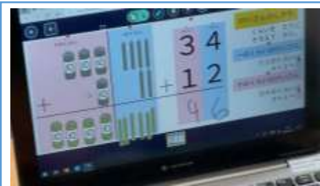
【写真2】タブレット上で計算棒を操作し、筆算の仕方を確認している場面