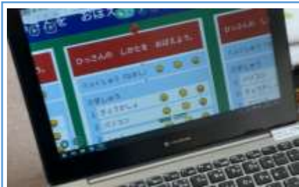
【写真1】1週間の指導計画から本時の見通しを確認している場面