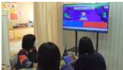
【写真 1】Kahoot!を使って、前時の復習を行っている様子