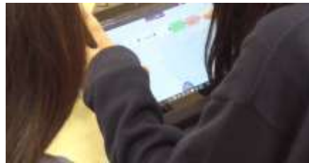
【写真 2】オクリンクを使って、正しい語順に単語を並べ替える様子