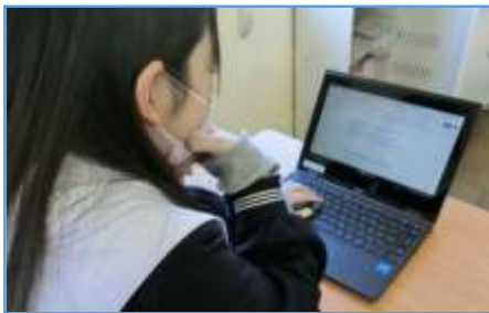
写真 1 : 文章を作成している場面