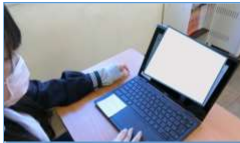
写真 2 : 文章を作成するために web ページを調べている場面