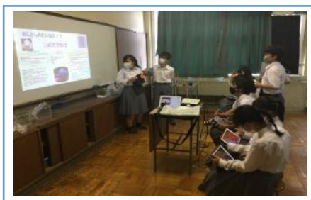
写真2：まとめた資料を発表している場面