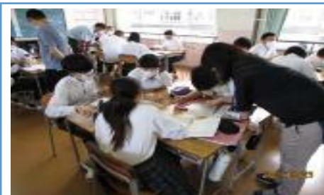
写真2：発表のための原稿づくりを行っている場面