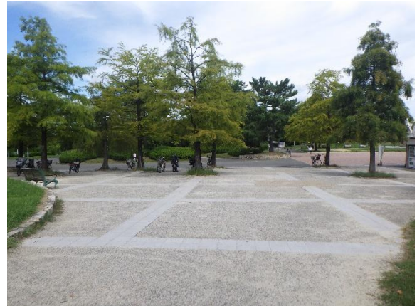
写真 園路・広場の劣化状況