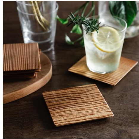
杉の素材を使ったコースター

工場の片隅にいた小さな木片や 真鍮パイプの端っこが、なんになるだろうか？ 価値のある材料だからこそ最後まで大切に、 職人が手をかけた新たなプロダクト。