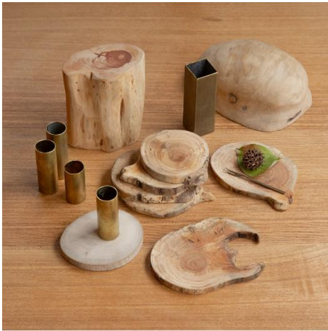
カケラを活かしたプロダクトたち

工場の片隅にいた小さな木片や 真鍮パイプの端っこが、なんになるだろうか？ 価値のある材料だからこそ最後まで大切に、 職人が手をかけた新たなプロダクト。