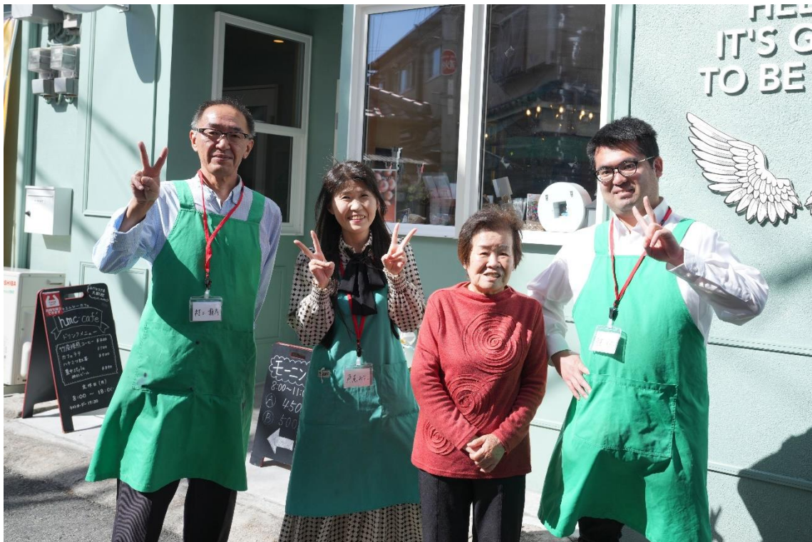
カフェの前で / In front of our cafe

The goal of the Handmade Candle Association is to create a space for people facing life's challenges, where they can find belonging and healing through candle-making.