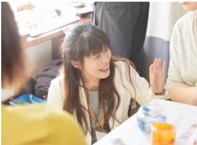
創業者・代表理事 / Founder, President

The Handmade Candle Association, General Incorporated Association is founded in August 2019, with the goal of helping individuals facing difficulties in life, along with their families and those involved in welfare, to connect with society through candle-making - a fun and therapeutic activity!