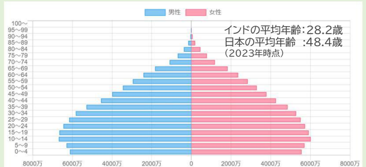
世界最大規模の若者人口を有するインド