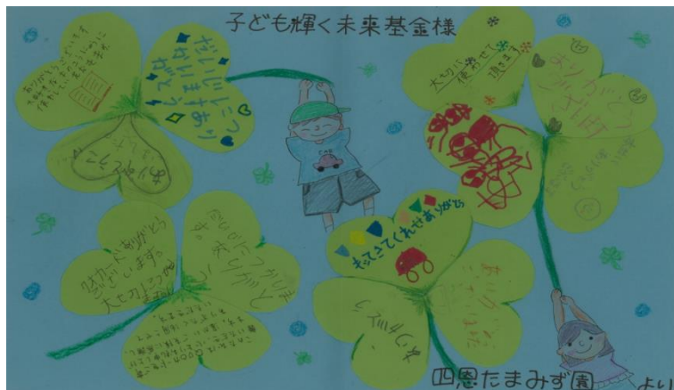
▲児童養護施設から届いた子どもからのメッセージやイラスト