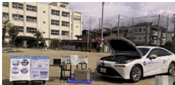
FCV展示・パネル展示・給電デモ