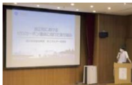
浪江町の水素取組紹介