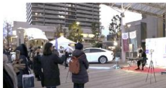
関係協定イベント