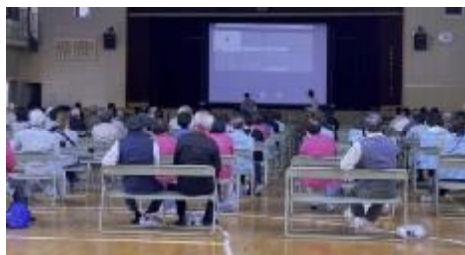
講堂にて事業説明