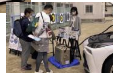
熱心に質問される来場者