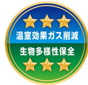
農産物の環境負荷低減に関する見える化ラベル（農林水産省）