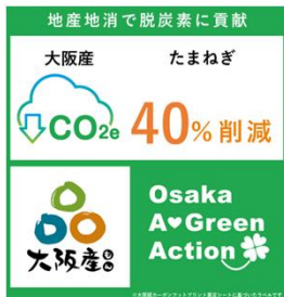
大阪版CFPラベル（大阪府）