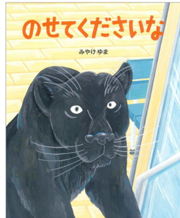
『のせてくださいな』