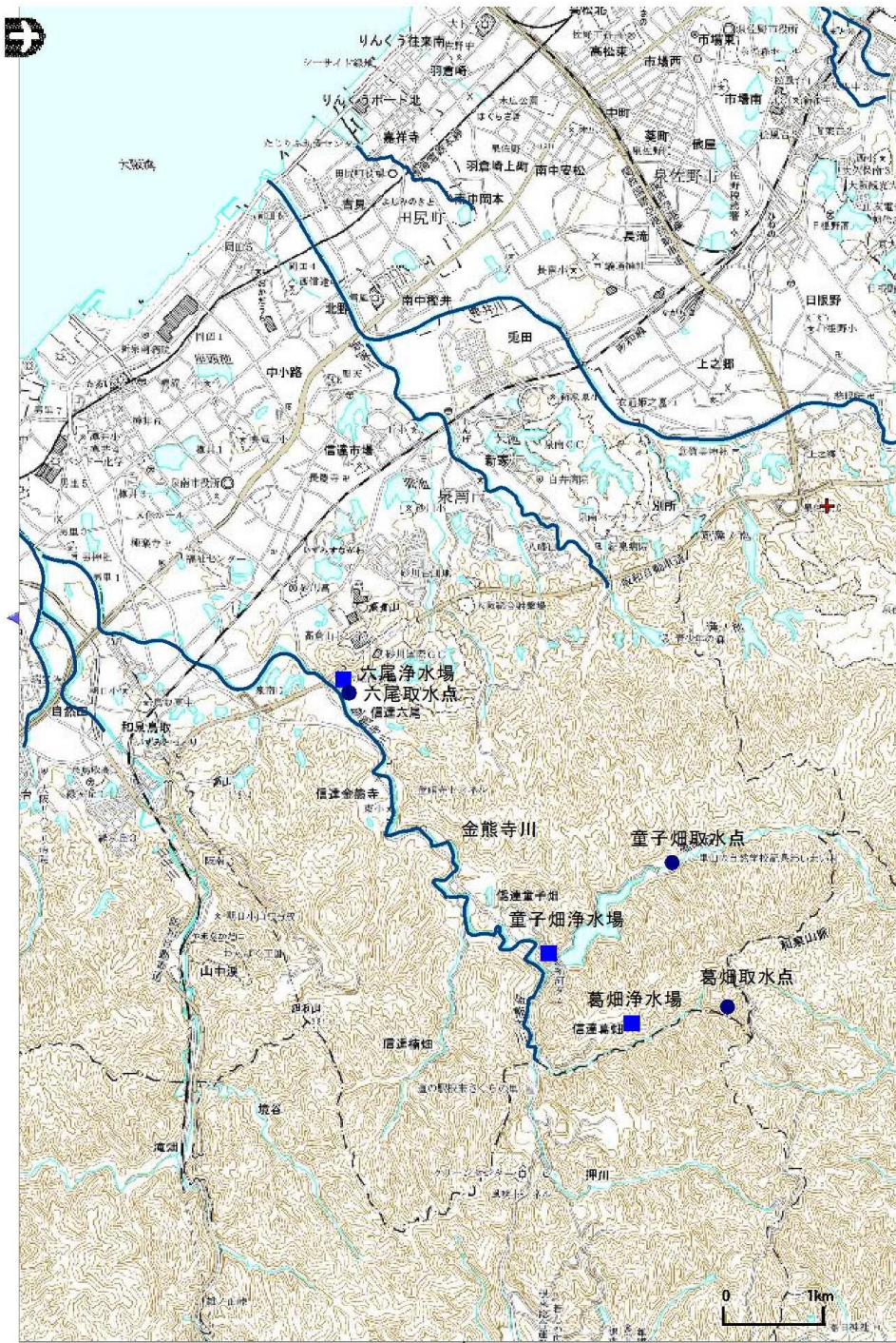
図1 金熊寺川流域図