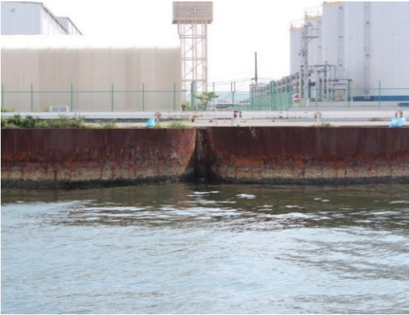
写真－2 鋼管セル護岸(施工前)