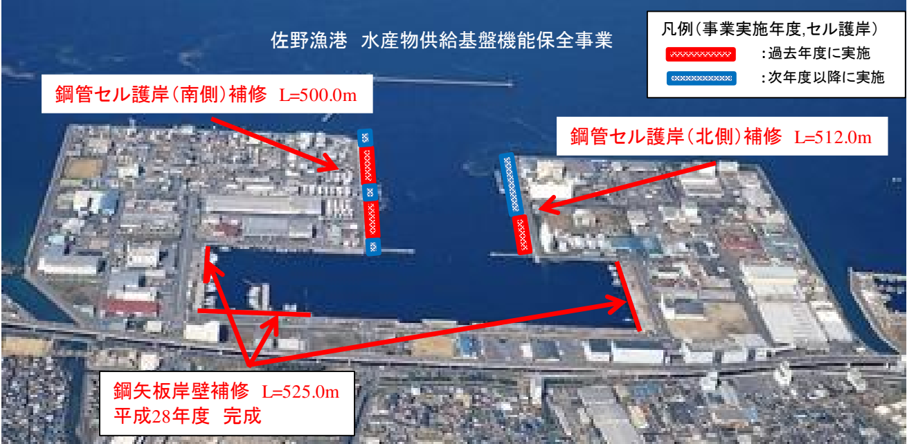
写真－1 佐野漁港(食品コンビニート地区)・実施予定箇所