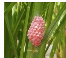
▲ジャンボタニシ成貝（左）と卵塊（右）