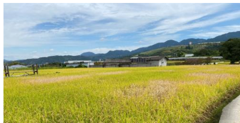
▲坪枯れが発生した田

《防除方法》トビイロウンカに効果の高い薬剤を選択し、育苗期の箱施用剤（ゼクサロン、リディア等）の施用や、本田での薬剤散布（エミリア、イクシード等）を実施しましょう。出穂期以降に薬剤を散布する場合は、トビイロウンカが生息する株元まで十分に届くようにしてください。株元への薬剤散布ができない場合は、出穂前の粒剤散布を行いましょう。