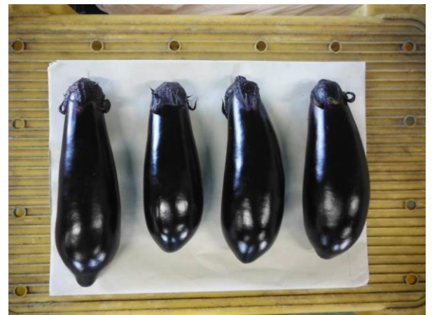
▲ 左から千両2号、あのみり2号、TNA112号、TNA113号