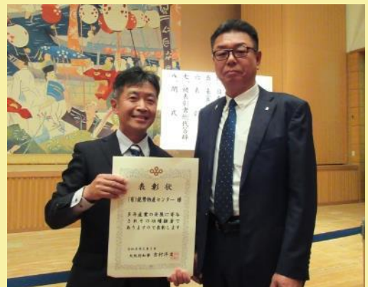
▲岡田代表取締役（能勢町長）（右） 西山支配人（左）

令和8年度 大阪府憲法記念日知事表彰 産業功労者（農林水産関係） （有）能勢物産センター（能勢町）