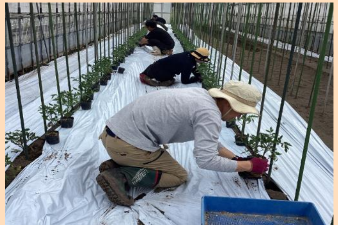
▲ フォローアップ研修の様子(4月18日)

ふたたび集まった受講生5名は、昨年度に引き続き、農業者の指導のもと熱心に作業に取り組み、お互いの近況を情報交換するなど、有意義な時間となっていたようでした。