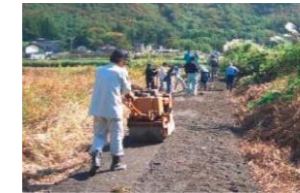
未舗装農道の舗装