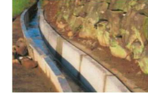
素掘り水路から更新