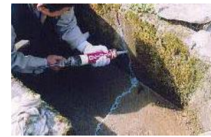
水路のひび割れ補修