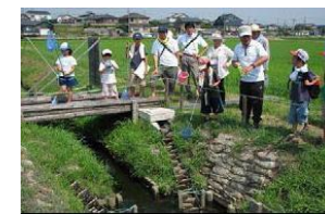
生物調査による啓発