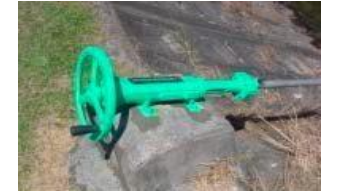
ゲート・バルブの更新