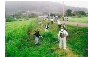
農地のり面の草刈