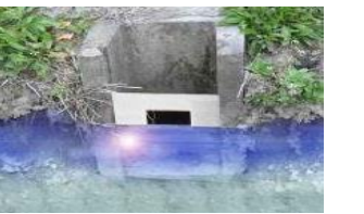
田んぼダムの実施