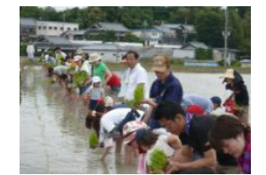
地域住民との交流活動