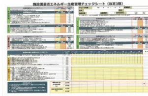
▲省エネチェックシート