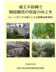
▲省エネで収益力向上を