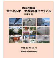
▲省エネマニュアル