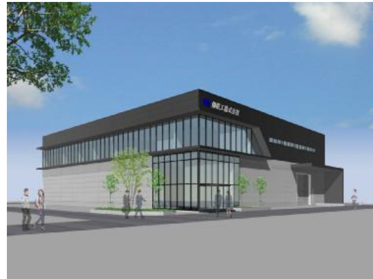
(新工場完成イメージ)