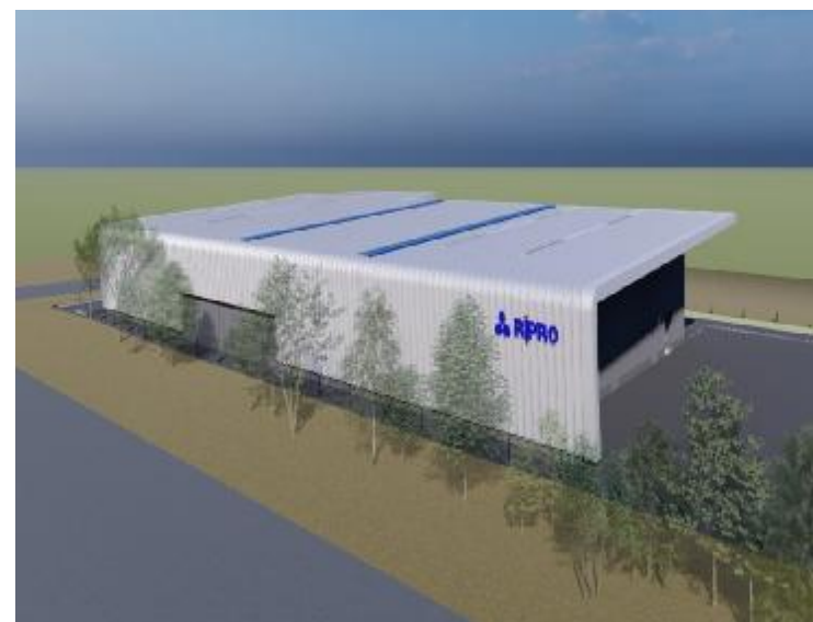
(新工場完成イメージ)