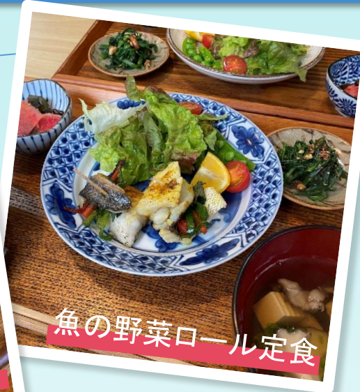
魚の野菜ロール定食