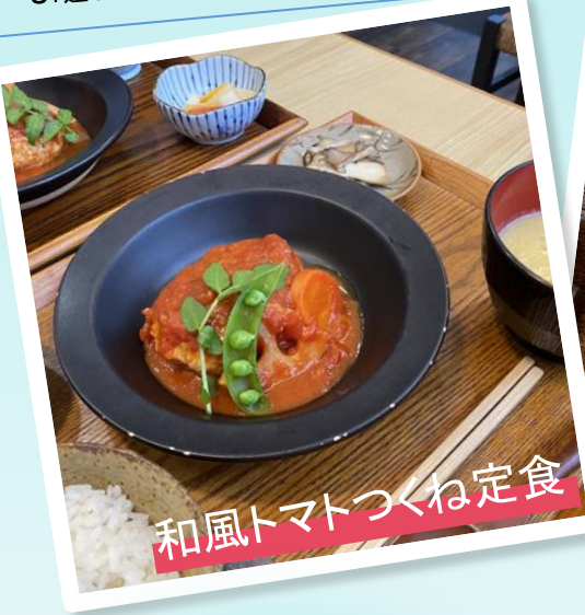
和風トマトつくね定食