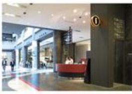
エスカレーターを降りると、1Fインフォメーション船に出ます。