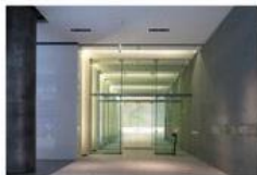
view C タワーCオフィスエントランスホールの突き当たり右手に進むと、エレベーターホール入口があります。