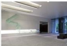
view B 正面[AIX]右手[TULLY'S COFFEE]のあいだ奥に、タワーCオフィスエントランスがあります。タワーCオフィスエントランスにお進みください。