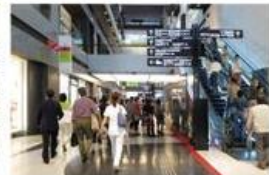
view A 北館に入ると正面に誘導サインが掲示されています。[カンファレンスルーム タワーC]を目指してお進みください。