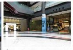
view A 北館に入ると正面に誘導サインが掲示されています。[カンファレンスルーム タワーC]の誘導に従って北館中央のナレッジプラザにお進みください。