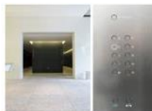
view D 8階上がります。(A・Bどちらのエレベーターでも使えます。)