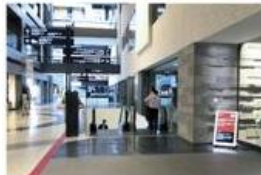
view B 右手タワーBオフィスエントランスを越えてすぐの下りエスカレーターに乗り1Fに降ります。