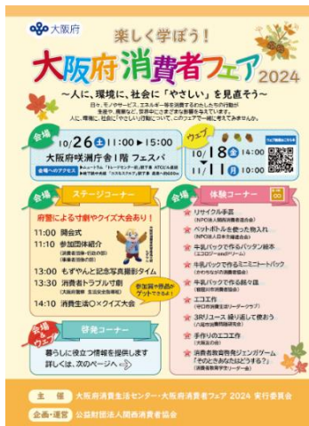
(消費者フェアチラシ表紙)

大阪府消費生活センターでは、平成3年度から毎年、多くの府民の方々に消費者問題についての理解を深めていただくため、消費者団体および事業者団体、行政等、多様な主体が連携し、消費生活に関するさまざまな情報をわかりやすく提供する、府民参加型イベント「大阪府消費者フェア」を開催しています。令和6年度も咲洲庁舎1階フェスパでの会場開催とウェブ配信の併催し、消費者団体19団体、事業者団体・行政26団体、会場とウェブを合わせて45団体にご出展いただきました。今回もチラシやX(旧ツイッター)、メールマガジン等で周知をした結果、たくさんの方にご参加(閲覧)していただくことができました。