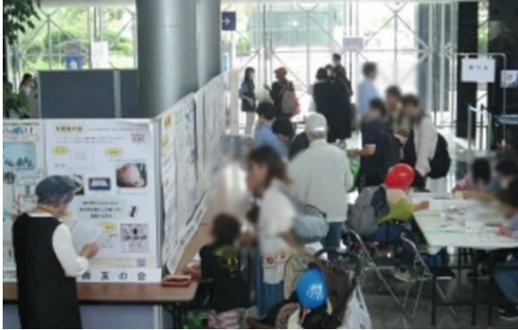
(啓発コーナーの様子)

「啓発コーナー」では、消費者団体および事業者団体・行政それぞれの日頃の研究成果や暮らしに役立つ情報などを展示・紹介していただきました。今年度は、新たな試みとしてデジタルサイネージによる展示・紹介を行いました。