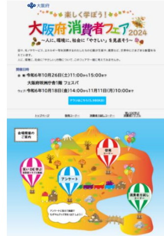
(ウェブ配信トップページ)

また、ウェブプログラムでもアンケートを実施し、回答いただいた方の中から抽選で 5 名に、もずやんグッズ等の景品を贈りました。