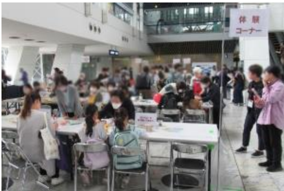
(体験コーナーの様子)

「体験コーナー」では、空き瓶・ペットボトル・牛乳パックなど身の回りにあるものを使ったエコ工作や手芸、巨大ジェンガによる消費者教育啓発プログラムなどの出展があり、お子様から大人の方まで楽しくご参加いただきました。