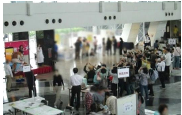
(消費生活〇×クイズ大会の様子)

「ステージコーナー」では、参加いただいた消費者団体および事業者団体・行政の団体紹介をインタビュー形式で行いました。そのほか、もずやんと記念撮影タイム、大阪府警察生活安全指導班による消費者トラブル寸劇、消費生活〇×クイズを行い、大いに盛り上がりました。特に消費生活〇×クイズでは、契約の成立時期についてのクイズを出題したところ、「間違えた」「知らなかった」という声がありました。