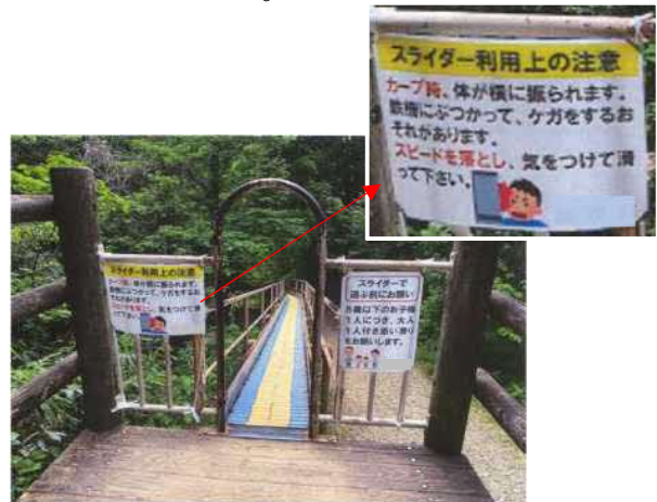
乗り口の注意喚起状況