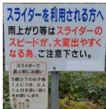
施設周辺の注意喚起状況