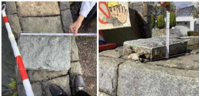
外れた修景用の石