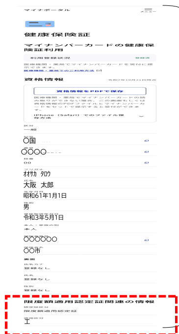
〈マイナポータルの健康保険証画面〉