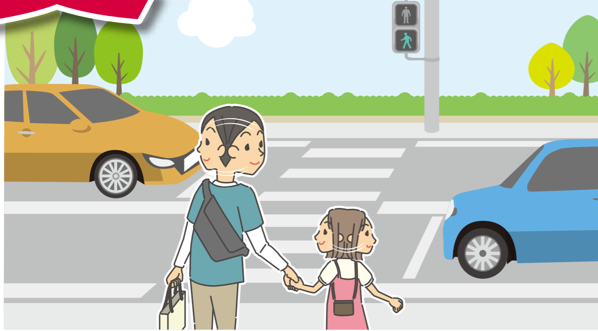
こどもの交通事故防止