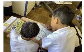
自分で選んだ絵本を、メロディーにのせて歌詞を作った後、お互いの歌を見せ合っている場面。