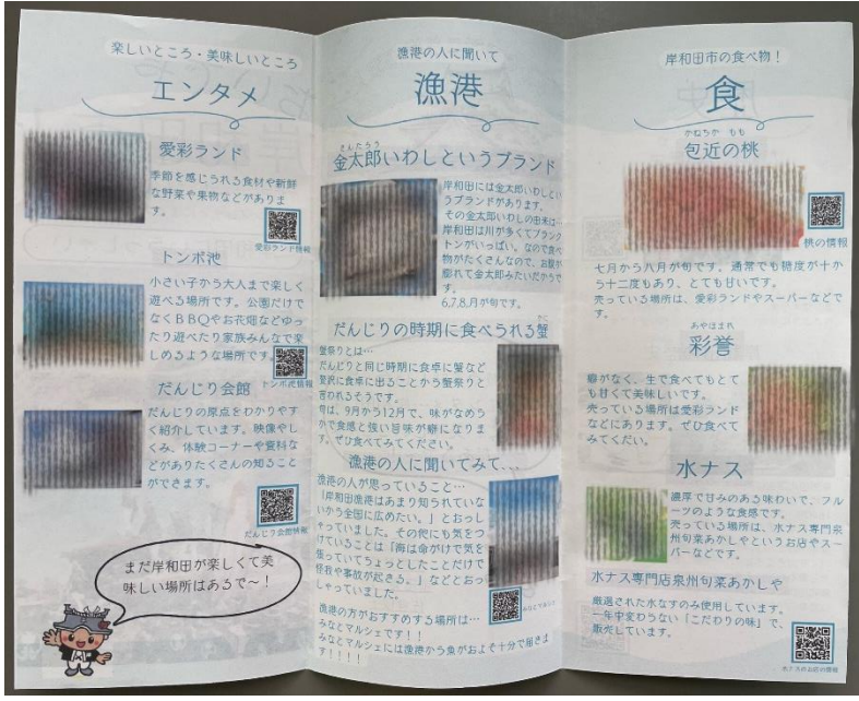
実際にインタビューで聞き取りした内容も盛り込んでいます。