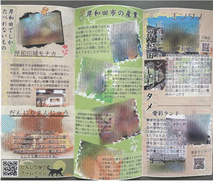
QRコードを使うアイデアは、本物の観光パンフレットから得ました。