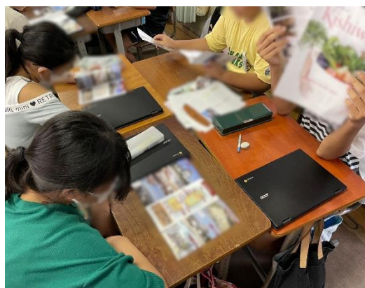
本物の岸和田市観光パンフレットを見比べています。