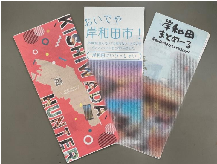
三つ折りのパンフレットに、岸和田市の魅力をまとめました。