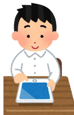
タブレット端末を活用して、学習上の困難さを補っている。