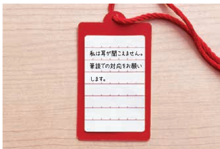
▲ 裏面にシールを貼り、必要な情報を記載することができます。