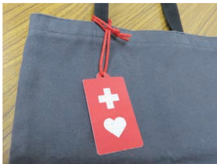
▲ 鞆等につけることができます。