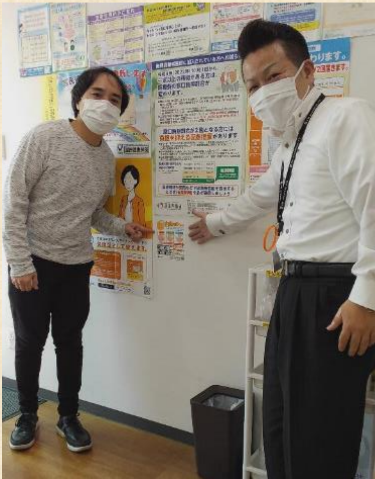
みつは城北公園通り薬局