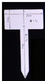
【土にさすタイプの樹名板例】