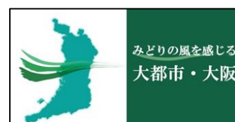
【みどりの風ロゴマーク】