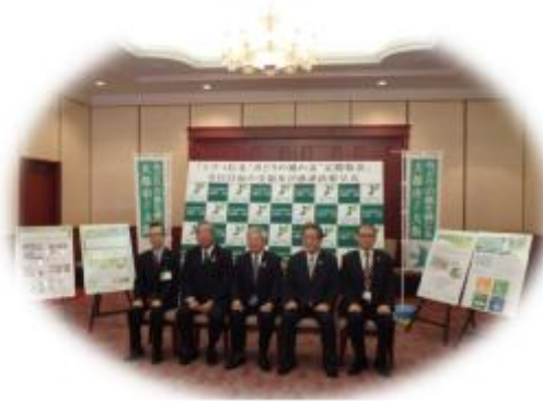
「みどりの風感謝祭」での感謝状贈呈の様子

※法人の寄附の場合、寄附金相当額が損金扱いになります。(法人税法第37条第3項)