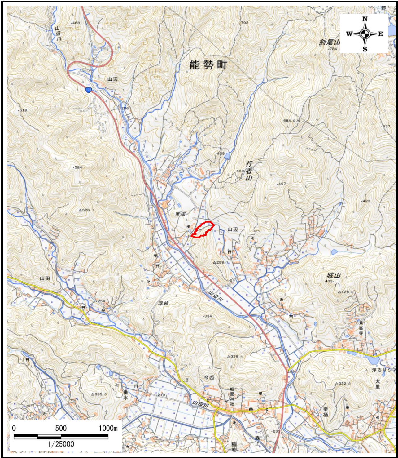
区域指定箇所概略位置図(1/25,000)