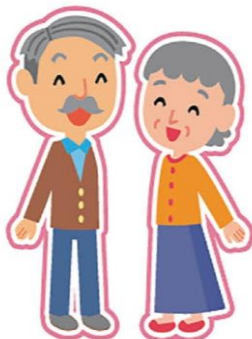
大阪府在住で65歳以上の方

運転免許証を自主返納、または運転免許を失効し運転経歴証明書 ※ の交付を受けた大阪府在住の65歳以上の方が、サポート企業・店舗において「運転経歴証明書」又は「運転経歴証明書交付済シールとマイナンバーカードの両方」を提示することにより、様々な特典を受けることができます。