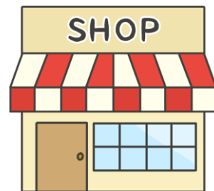
サポート企業・店舗

「運転経歴証明書」又は 「運転経歴証明書交付済シールと マイナンバーカードの両方」を提示