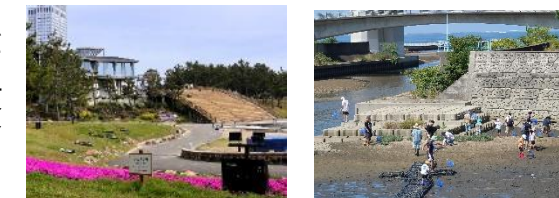
公園整備事業 公園を活用した地域の活性化

多様なニーズに応えるため、制度・しくみの見直し等によりインフラを有効活用することや関係者との連携により、都市魅力の向上に取り組み、またみどりの創出や都市環境の向上などに取り組むことで、地域資源を活かした質の高い、住みよい都市の実現をめざします。