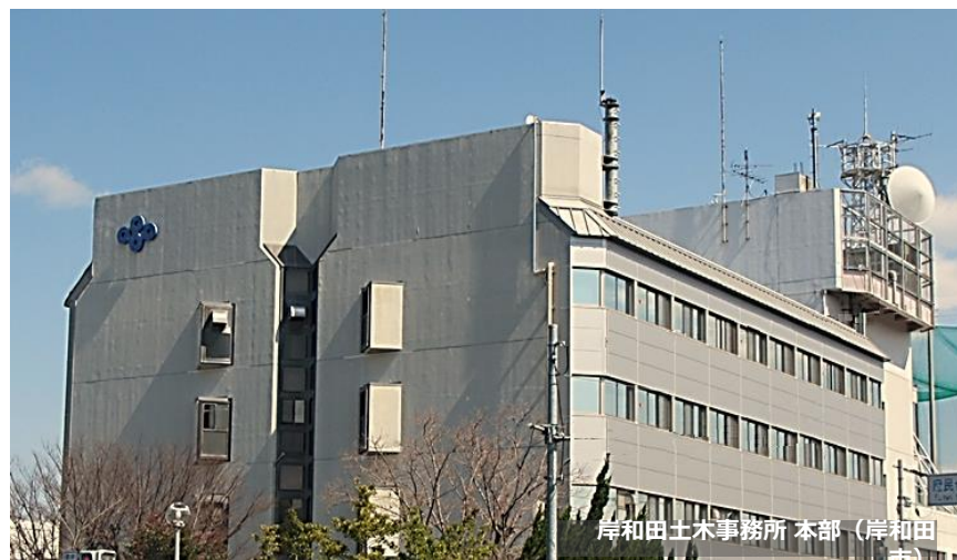
事務所職員数の推移（単位：人）