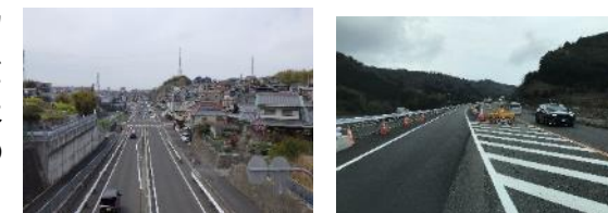
道路整備事業 道路改良事業

交通インフラの充実・強化や都市拠点の形成など様々なネットワークを重視した都市づくりをさらに進めるなど、必要な都市基盤整備を推進し、世界で存在感を発揮する東西二極の一極として、日本の未来を支え、けん引する成長エンジンとなる副首都・大阪として発展をめざします。