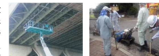
橋梁補修事業 日常維持管理(段差補修)

市町村のニーズに応じた公共施設の維持管理、再編整備等の技術支援体制の充実を図ります。