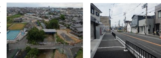
河川改修事業 交通安全対策事業

交通安全対策やユニバーサルデザイン化の推進など、誰もが安全・安心に移動できる都市の実現をめざします。