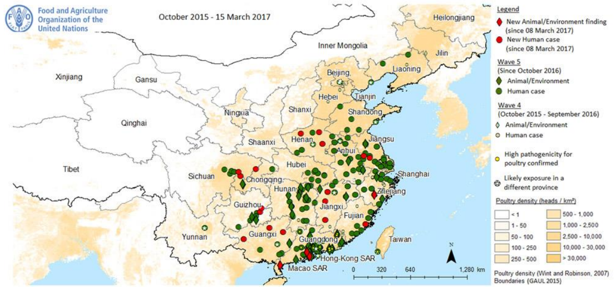
図3. 中国本土の鳥インフルエンザ A (H7N9) ヒト症例とトリ・環境中の陽性例の報告地域 2015年10月～2017年3月15日 (文献14から引用)