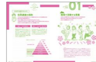
コンセプトの紹介イメージ