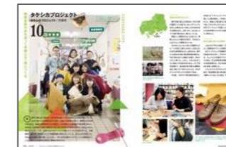
活動紹介などのイメージ