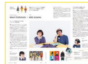
対談ページのイメージ