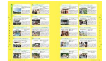
全イベント集のイメージ