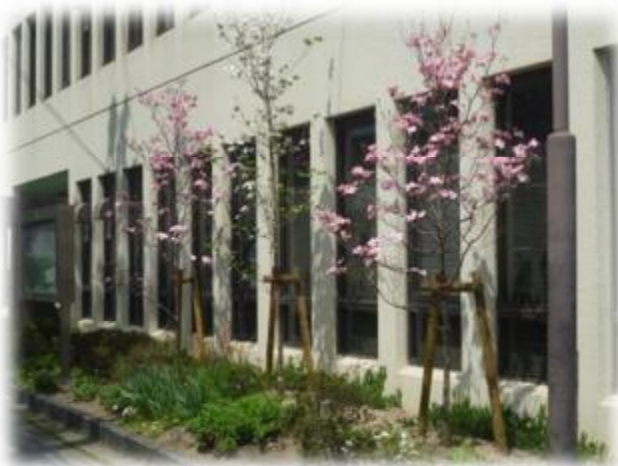
花の咲く高木を追加することで彩ある空間に