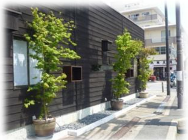
プランターを使用した緑化も可能