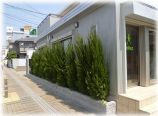
限られた空間を有効活用して緑視効果を高める