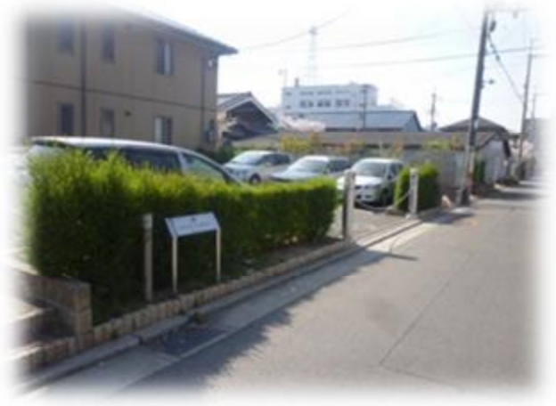
駐車スペースを減らすことなく駐車場緑化